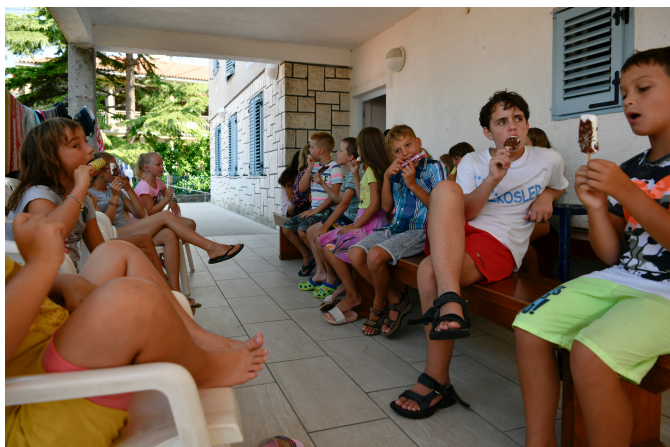
Terasa pri domu

Okolica doma je mesto Piran z vsemi svojimi znamenitostmi. Možnosti za raziskovanje in spoznavanje mesta je ogromno. Na željo gostov organiziramo tudi voden ogled mesta. Možni so sprehodi v Portorož, Fiesio, ipd.